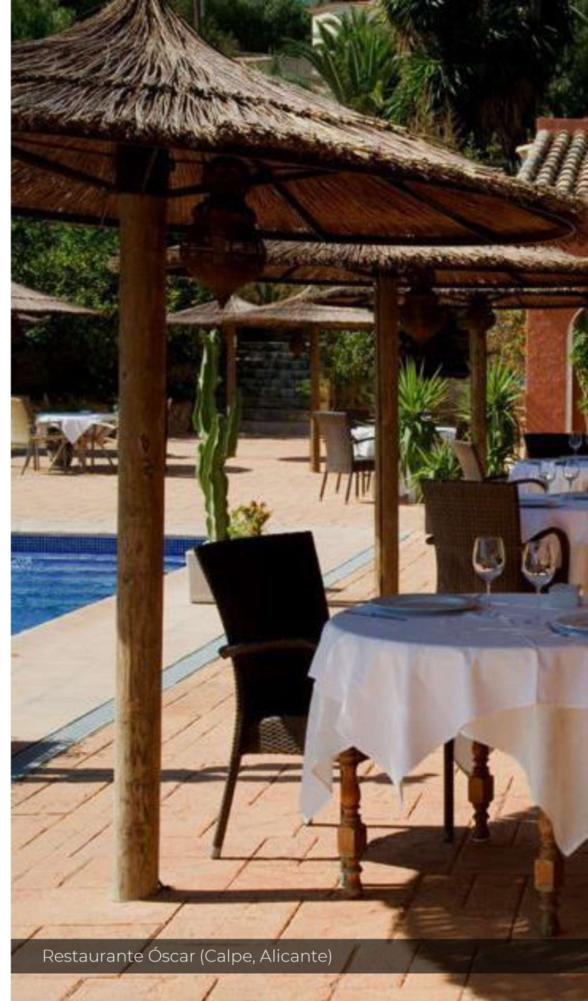
Restaurante Óscar (Calpe, Alicante)