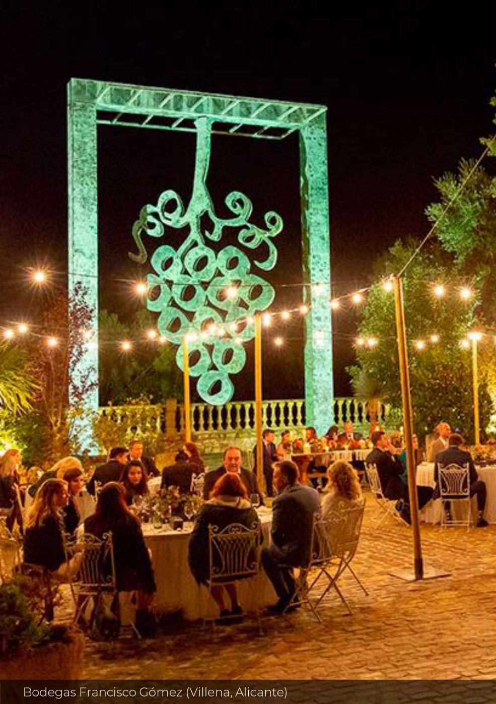
Bodegas Francisco Gómez (Villena, Alicante)