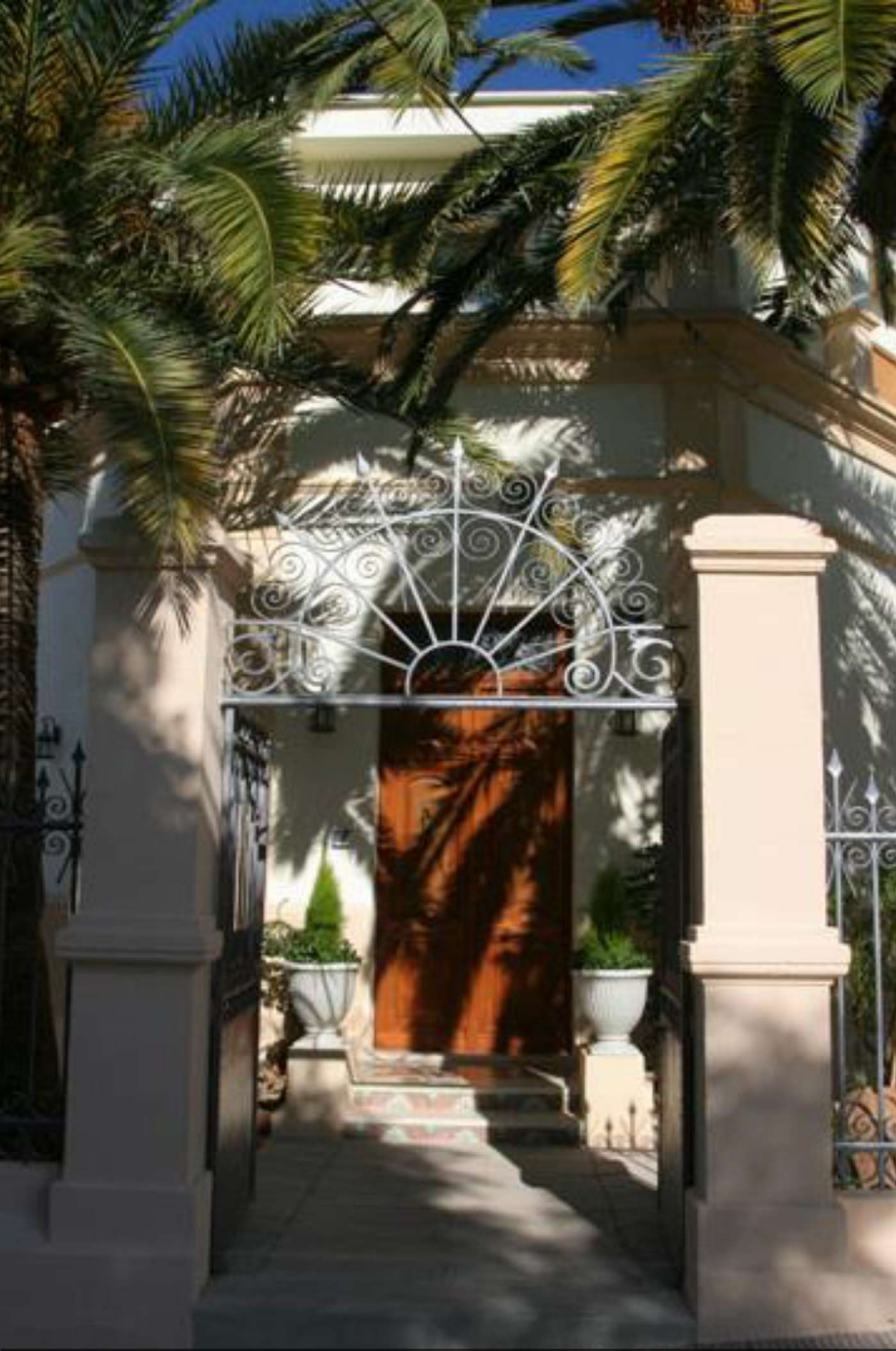
Hotel Restaurante Casa Julia (Parcent, Alicante)