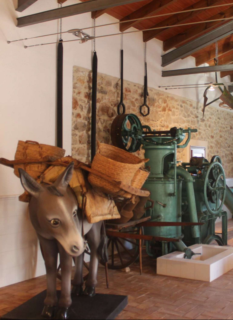
Museo Etnológico Alcalalí (Alcalalí, Alicante)