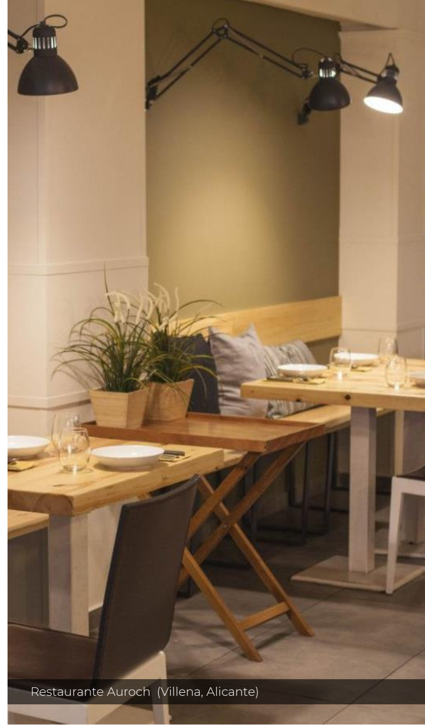
Restaurante Auroch (Villena, Alicante)