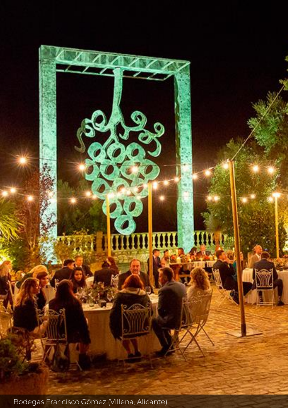
Bodegas Francisco Gómez (Villena, Alicante)