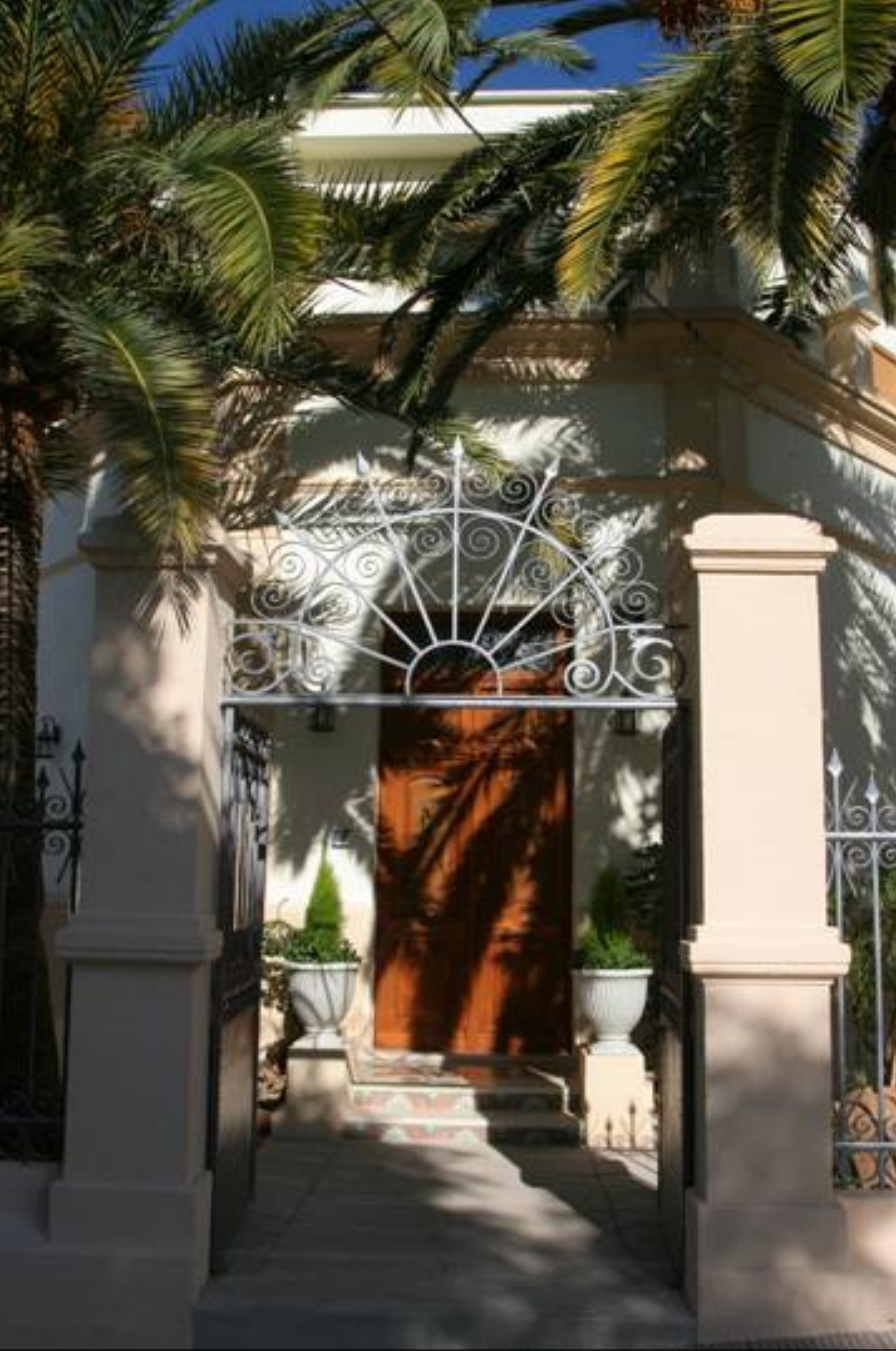
Hotel Restaurante Casa Julia (Parcent, Alicante)