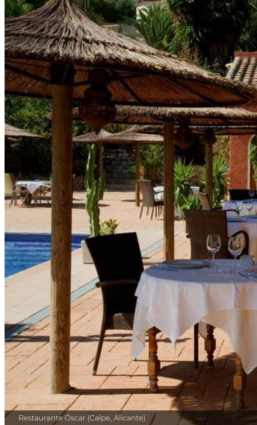
Restaurante Óscar (Calpe, Alicante)