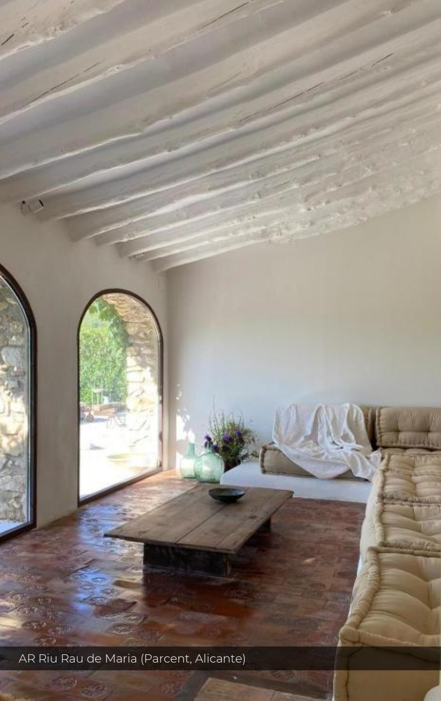
AR Riu Rau de Maria (Parcent, Alicante)