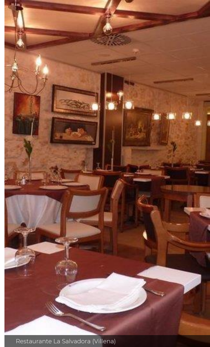
Restaurante La Salvadora (Villena)