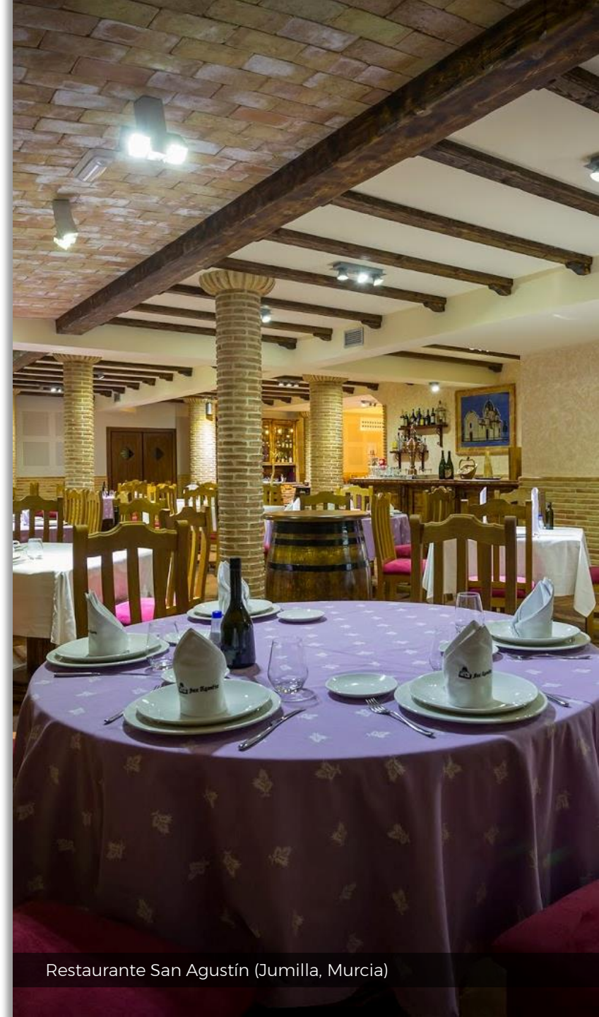
Restaurante San Agustín (Jumilla, Murcia)