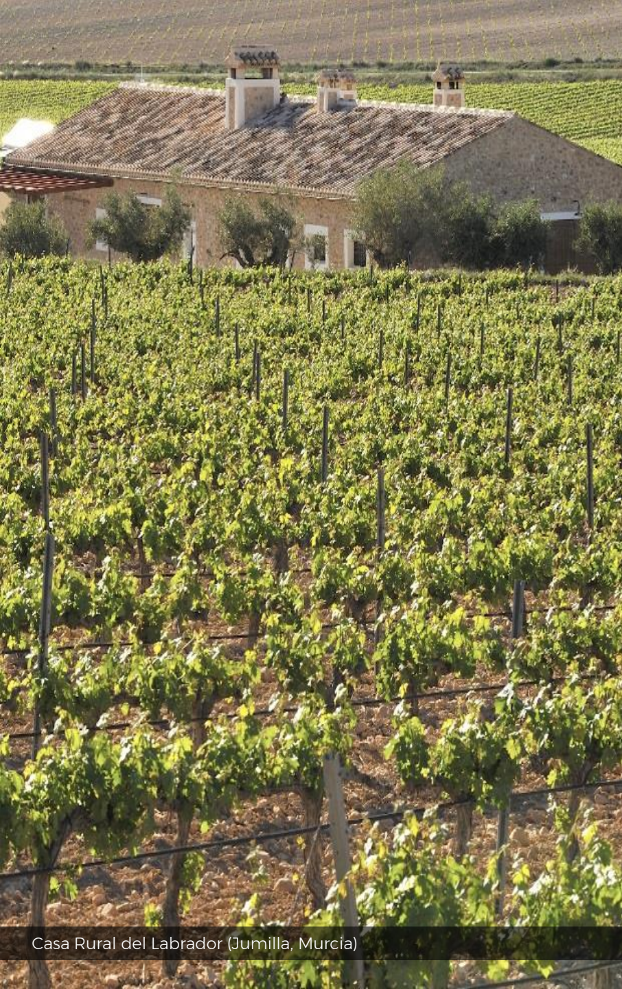
Casa Rural del Labrador (Jumilla, Murcia)