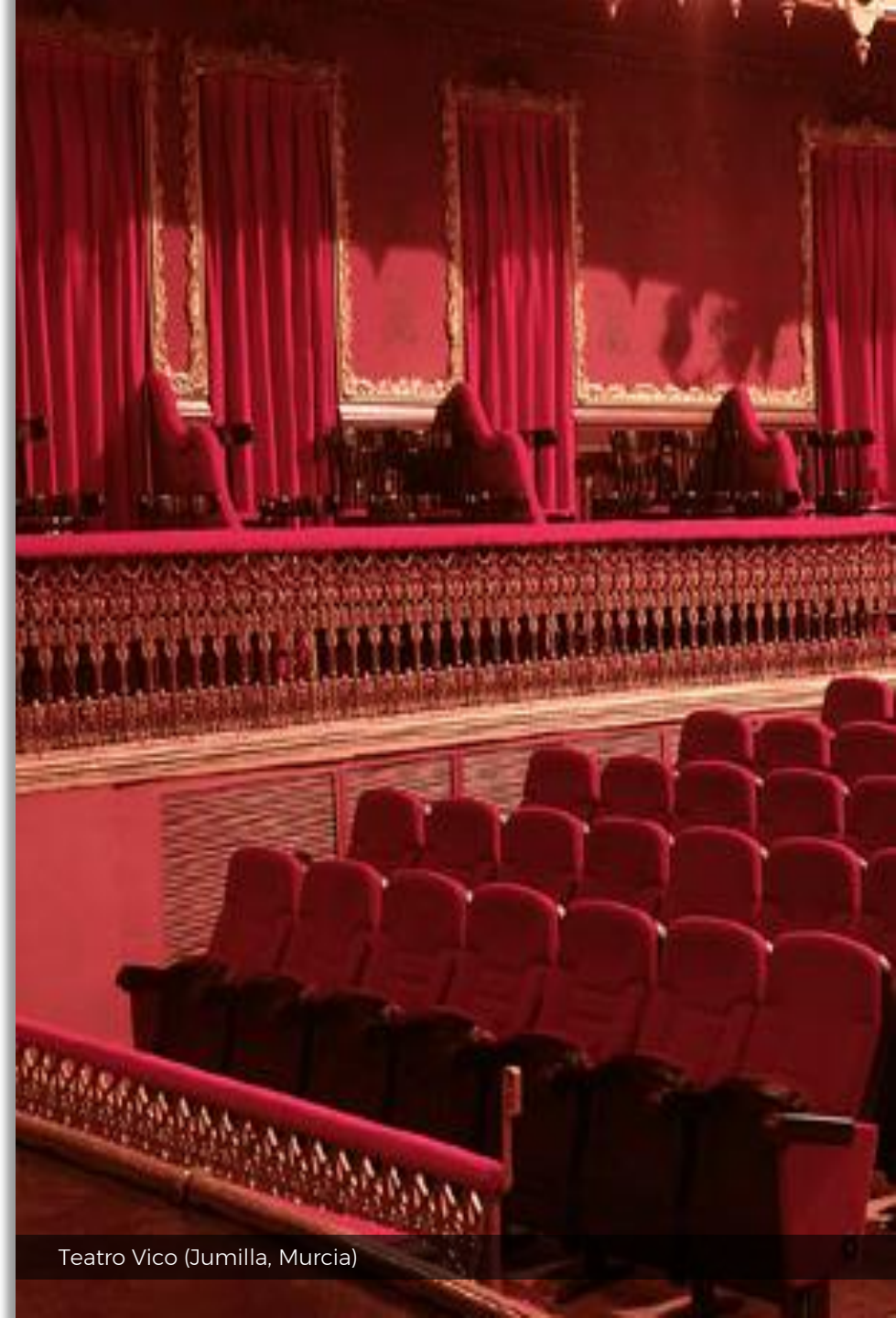
Teatro Vico (Jumilla, Murcia)