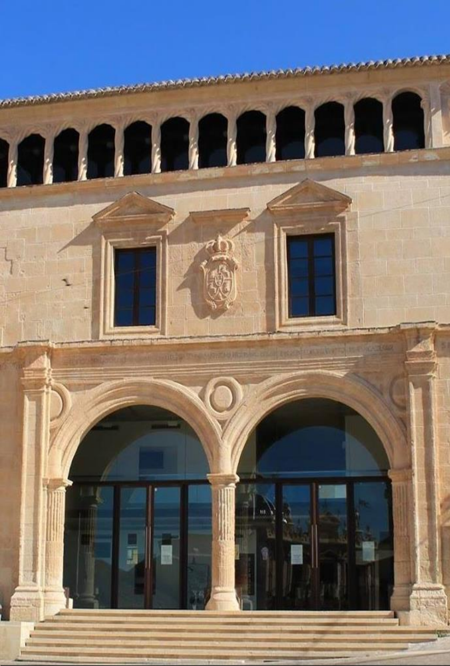
Museo Municipal Jerónimo Molina (Jumilla, Murcia)